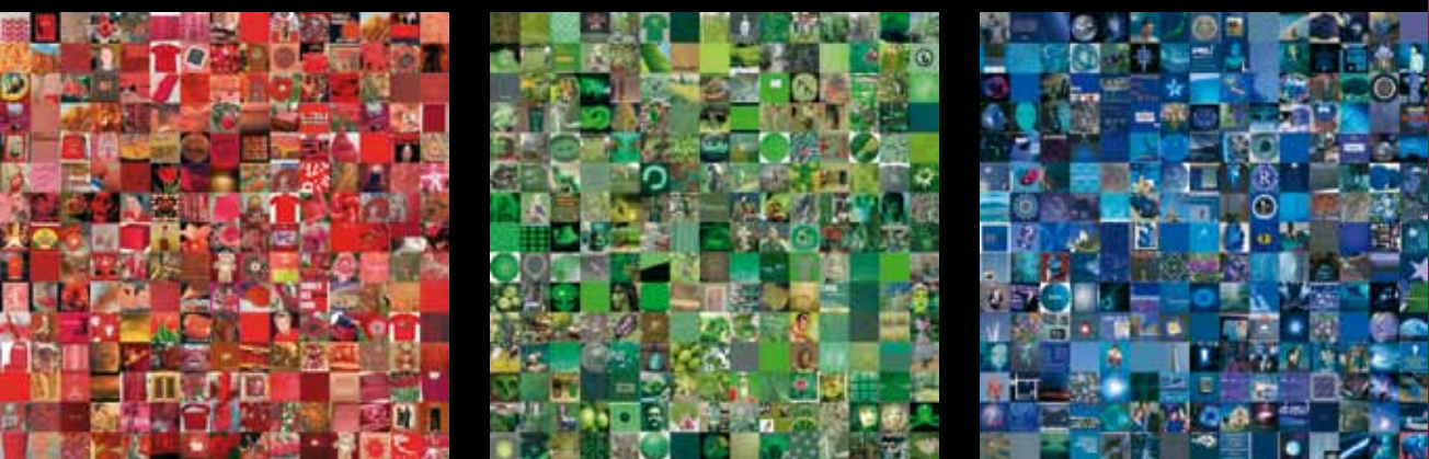
Monochrome(s) R V B, 2005, installation multimédia générative, sans son.